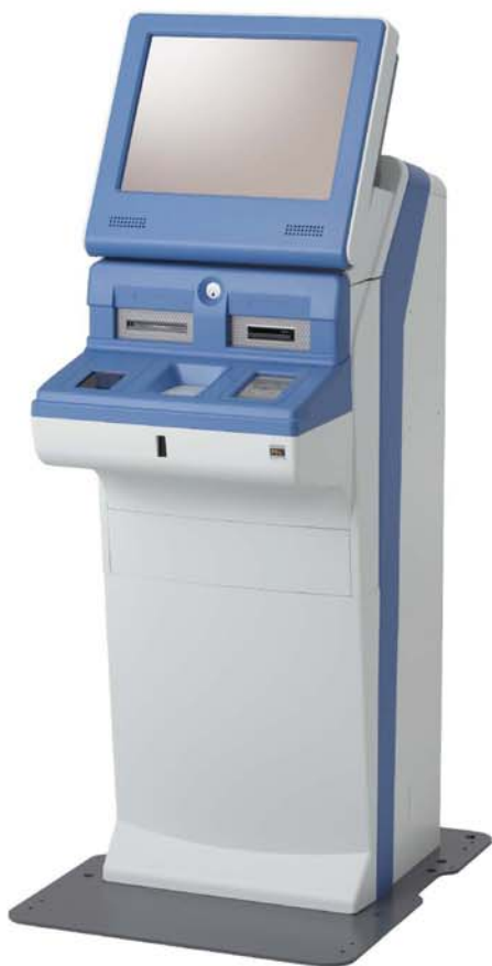
MEDIASTAFF EV (PFU社製)